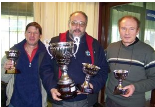
Ganadores de la Copa Paladini (11,25)

Fue instituida por la FAT en el año 2006 en honor de quién fuera su Vicepresidente, Juez internacional de Tiro premiada como la mejor Juez en la Copa del Mundo de Cuba en 1997 (recibió medalla y diploma de la International Sportiv Shooting Federation), dirigente en el Tiro Federal de San Luis y deportista, en la disciplina 25 m. Pistola 11,25 m.