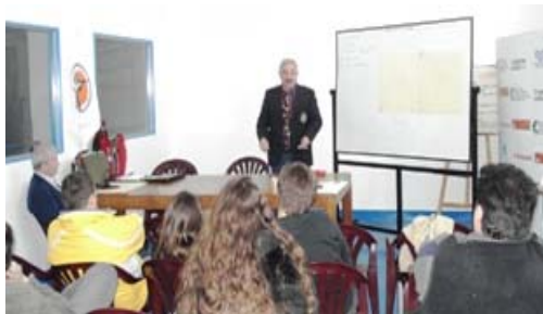
En Buenos Aires

La FAT invitó a los tiradores destacados de la zona de influencia de cada una de las sedes. A las Instituciones que nos brindaron sus instalaciones, se les otorgo la posibilidad de incluir tiradores, que por su nivel estuvieran capacitados para participar del curso.