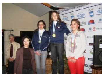
Podio cadetes mayores damas Rifle de Aire