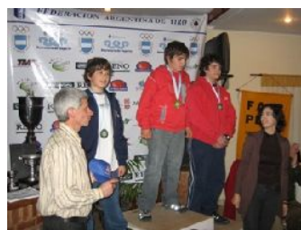
Podio cadetes menores

El Tiro Federal de San José, provincia de Entre Ríos polígono decano de la Argentina, cuna del tiro deportivo que en el próximo año cumplirá 150 años de existencia, fue la institución anfitriona para la organización del Campeonato Nacional y Torneo Argentino Juvenil por parte de la Federación Argentina de Tiro los días entre el 17, 18 y 19 de julio y 21 de julio dirigido a tiradores de hasta 18 años de edad, participando competidores de los polígonos de Baradero, Córdoba, General Alvear, La Plata, Quilmes,