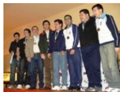
Podio equipo hombres senior de Pistola de Aire

La institución anfitriona del 66° Campeonato Nacional de Armas de Aire organizado por la Federación Argentina de Tiro fue el Tiro Federal Argentino en la Ciudad Autónoma de Buenos Aires. Se disputó los días 5 y 6 de julio ppdo. en las especialidades 10 m. Pistola y Rifle de Aire.