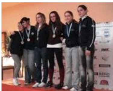
Podio de los equipos damas mayores de rifle de Aire