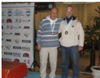
Podio del equipo de veteranos de Pistola de Aire