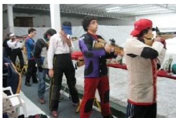
En la línea de tiro