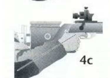
Fig. 4c. La posición ideal: el antebrazo y la mano se encuentran en línea recta, el dedo del gatillo se mueve paralelamente al eje del cañón. De esta manera, el gatillo puede ser activado rápidamente sin ningún impulso que lo obstruya. El brazo absorbe una parte del movimiento de retroceso del arma y contribuye a una moderada reacción del cañón.

Fig. 4b. Una torcedura hacia abajo indica una posición de lo mano demasiado suelta a una empuñadura demasiado delgada.