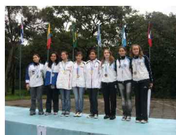
el podio en Rifle de Aire Damas

Con la participación de veintidós países de habla hispana (Antigua y Barbuda, Argentina, Brasil, Bolivia, Chile, Colombia, Costa Rica, Cuba, Ecuador, El Salvador, España, Guatemala, Honduras, Islas Vírgenes, México, Nicaragua, Perú, Portugal, Puerto Rico, República Dominicana, Venezuela y Trinidad Tobago) y la intervención de los Estados Unidos de Norteamérica como invitado, se disputó entre el 6 y 12 de junio en la Ciudad de Guatemala, en el moderno polígono de la Federación Guatemalteca de Tiro, el 1º Campeonato organizado por la Confederación Iberoamericana de Tiro del cual la Argentina es miembro fundador.