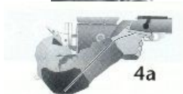
Fig. 4a. Una posición como ésta es a menudo causada por una empuñadura inapropiada o una culata demasiado corta. Si la mano traza una línea como ésta, se debería hacer una revisión de ambos factores.

Fig. 3.- Antebrazo y muñeca se extienden, el dedo del gatillo presiona en línea recta hacia atrás. Uno mismo puede estimar con mucha precisión el curso de presión, pudiendo apreciar, por medio de la sensibilidad, si está correcto.