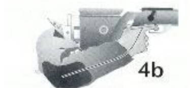
Fig. 4b. Una torcedura hacia abajo indica una posición de lo mano demasiado suelta a una empuñadura demasiado delgada.

Fig. 4a. Una posición como ésta es a menudo causada por una empuñadura inapropiada o una culata demasiado corta. Si la mano traza una línea como ésta, se debería hacer una revisión de ambos factores.