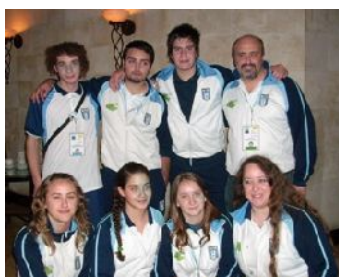
El equipo argentino