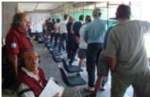
Polígono de la Asociación de Tiro de Quilmes