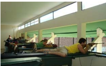
Vista de polígono de Pergamino

La CLINICA de Tiro Deportivo fue para armas largas y cortas con tiradores de esta Institución y otros que se acercaron de Junín y San Jerónimo Sud.