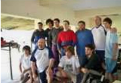
Tiradores y entrenadores

En esta oportunidad también se realizó tarea personalizada con tiradores de la Institución y de otras instituciones (Quilmes, Chivilcoy) que se movilizaron hasta Baradero para participar.