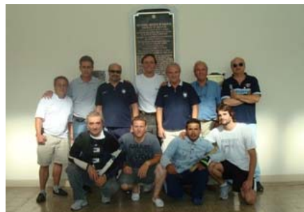
Tiradores y entrenadores juntos