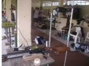
Vista del Stand de Tiro Baradero