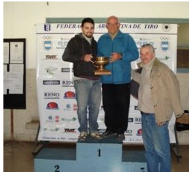
Ganadores de la Copa FAT