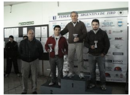
Podio de Pistola

El sábado 13 de septiembre la Federación Argentina de Tiro organizó en el Tiro Federal Argentino de Buenos Aires la disputa de la COPA "FEDERACIÓN ARGENTINA DE TIRO" en las especialidades 50 m Pistola Hombre y 50 m Rifle Tendido .