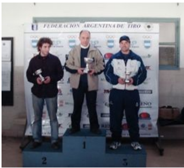
Podio de Rifle Tendido